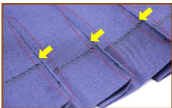
※上図は、スカートを裏返した画像です。 24本全ての奥ヒダにコバステッチをかけます。